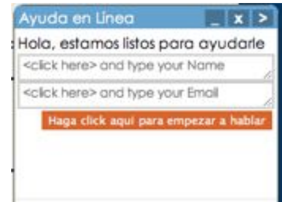
Servicio de Chat en Línea