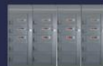
Centro de control de motores