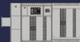
Tableros de distribución autosoportados